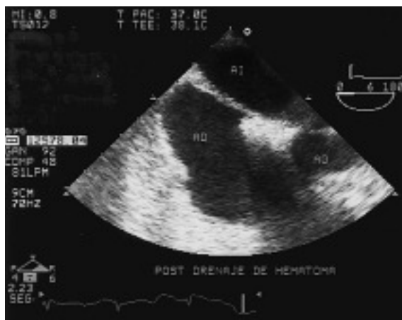
Figura 2. Imagen obtenida por ecocardiograma transesofágico tras la evacuación del hematoma retroauricular en la que se observa la aurícula derecha expandida; AI: aurícula izquierda; AD: aurícula derecha; VI: ventrículo izquierdo; AO: aorta.

Se orientó como taponamiento pericárdico y la ecocardiografía transtorácica mostró un derrame pericárdico ligero que no explicaba el cuadro clínico, por lo que se realizó un ecocardiograma transesofágico, que documentó una compresión extrínseca de la aurícula derecha con colapso total de la cavidad por un hematoma retroauricular (fig. 1). En la misma unidad de cuidados intensivos se reabrió en la zona subxifoideo un punto del final de la herida quirúrgica de la esternotomía, suficiente para introducir una cánula quirúrgica de aspiración. Guiándose me-