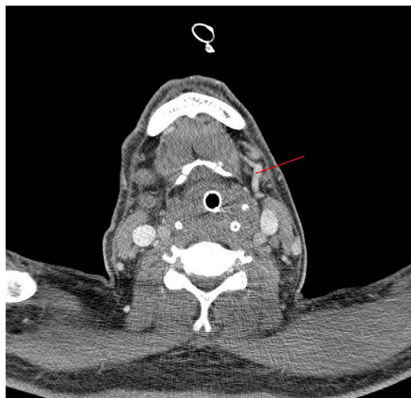
Figura 1 Trombosis de vena yugular externa derecha. En la imagen se aprecia la vena yugular externa izda. permeable (flecha) y la contralateral ausente (trombosada).

El paciente requiere durante las primeras horas amplia expansión de volemia, apoyo inotrópico, intubación orotraqueal y soporte respiratorio con ventilación mecánica. Tras la estabilización del paciente, nuevos controles radiológicos de cuello confirman la presencia de flemón en fosa amigdalal derecha que se extiende al espacio retofaríngeo, hipofaríngeo y espacios parafaríngeo y masticador. Una TAC a la semana de evolución, muestra trombosis de la vena yugular externa derecha, en la región submandibular (fig. 1), siendo ambas venas yugulares internas permeables.