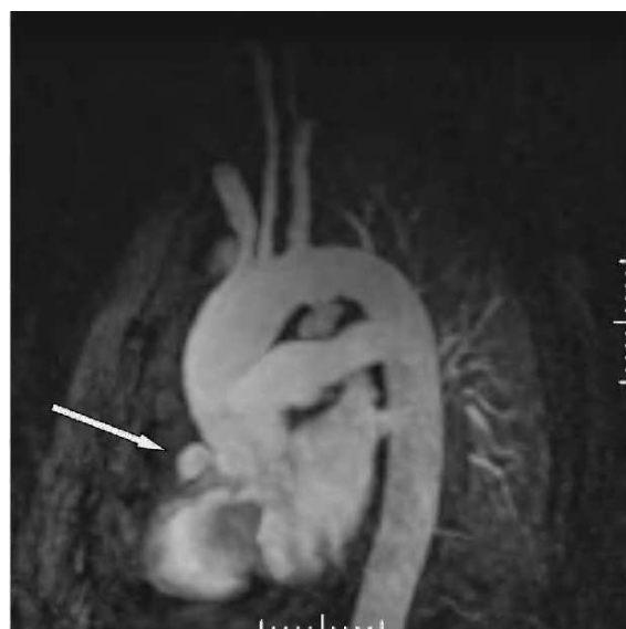
Figura 5. Angiorresonancia magnética nuclear torácica: dilatación aneurismática de arteria coronaria derecha.

tes, entre los años 1960 y 1974, la etiología más frecuente era la estafilocócica, describiéndose sólo dos casos de etiología neumocócica, ambos en el seno de neumonía y empiema. En esta serie, los pacientes con infección postoperatoria o con infección secundaria a afectación intracardíaca tenían un pronóstico infausto, siendo mejor en aquellos casos secundarios a infección pleuro-pulmonar o diseminación hematógena 3 . En otra experiencia de 12 años (1975-1987) que incluía 15 casos, se describió una elevada tasa de infección por anaerobios o polimicrobiana (superior al 50%), describiéndose sólo un caso de etiolo-