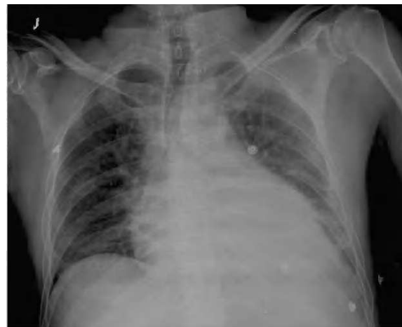
Figura 2. Radiografía posteroanterior de tórax; cardiomegalia y borramiento costofrénico izquierdo.

Consultado el caso con el Servicio de Cirugía Cardíaca se decide mantener tratamiento médico y