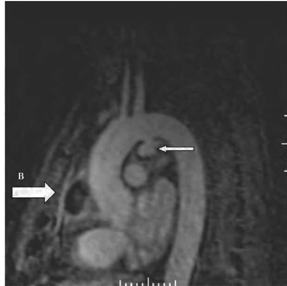
Figura 4. Angiorresonancia magnética nuclear torácica: aneurisma en cayado aórtico (A) y colección intrapericárdica (B).

En la era preantibiótica, la etiología neumocócica era la más prevalente. En una revisión de 26 pacien-