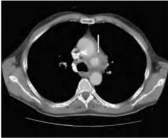
Figura 3. Tomografía computarizada de tórax: imagen de aneurisma en cayado aórtico (flecha).

actitud expectante. En ecocardiogramas posteriores mantiene mínimo derrame pericárdico, sin signos de taponamiento y con imágenes de organización en su interior. Presenta buena evolución hemodinámica, respiratoria y general, siendo dado de alta de la UCI a los 5 días de su ingreso. En ecocardiograma transtorácico realizado 10 días después, con el enfermo asintomático, se detecta imagen de probable pseudoaneurisma en cayado aórtico, y persistencia de derrame pericárdico. Se practica resonancia magnética nuclear torácica que documenta la presencia de un aneurisma en cayado aórtico, distal a la salida de troncos supraaórticos, probable aneurisma de arteria coronaria derecha y colección intrapericárdica (figs. 3, 4 y 5).