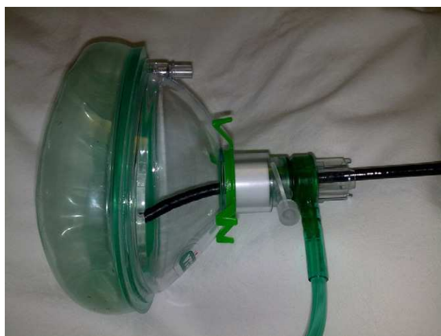
Figura 2 Válvula de Boussignac conectada a una mascarilla. Fibrobronscopia a través de la válvula.

Presentamos 3 casos en los que la realización del procedimiento endoscópico en situación límite (pO 2 /FiO 2 < 150)