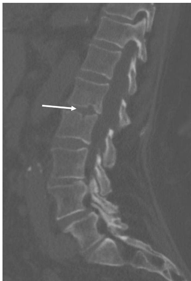
Figura 2 Corte de TC con las lesiones a nivel de L1-L2 indicativas de espondilodiscitis.

Después de más de 2 años de su ingreso en nuestra unidad, la paciente sigue realizando vida normal para su edad y viene regularmente a realizar sus controles periódicos de seguimiento de marcapasos. Para finalizar, resulta interesante destacar del caso por un lado la necesidad de implantar un dispositivo artificial en un paciente con una infección con un microorganismo con gran afinidad por dichos dispositivos donde la estrategia empleada fue efectiva (doble tratamiento antifúngico y esperar 6 semanas). Por otro lado, la favorable evolución de la paciente, a pesar de la gran mortalidad descrita en la bibliografía, no solo es interesante sino que constituye un motivo de satisfacción para nuestro equipo.