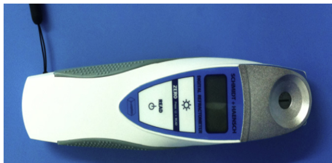
Figura 1 Refractómetro digital portátil (Digital Refractometer DHR-60, Schmidt-Haensch®).