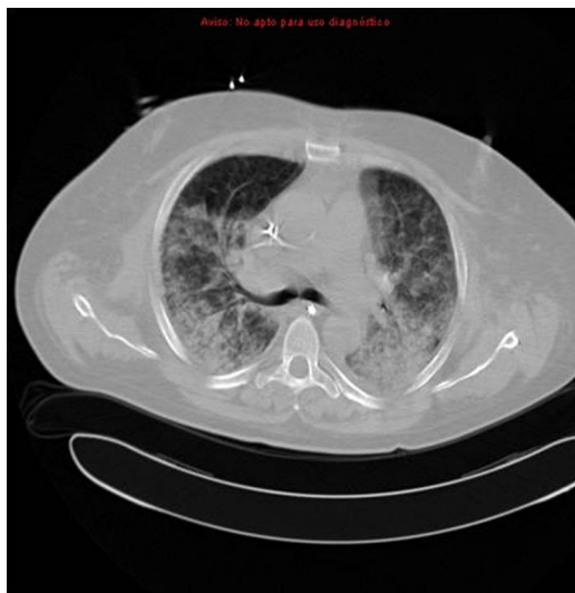
Figura 1 Tomografía computarizada torácica con presencia de condensaciones y áreas de aumento de la atenuación pulmonar en vidrio deslustrado bilateral.