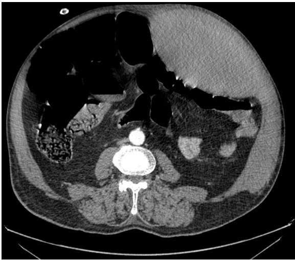
Imagen 1 Gran hematoma de la vaina de los rectos con extensión lateral.