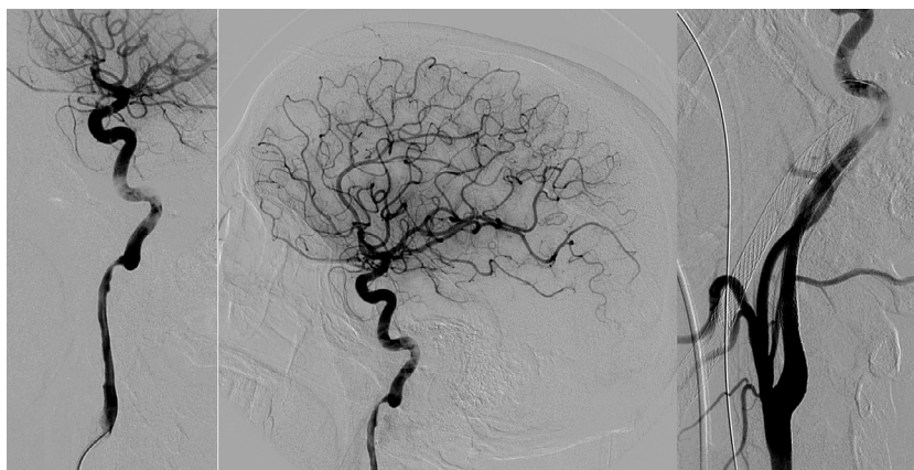
Figura 2 Disección de arteria carótida izquierda. La angiografía muestra CAD extracraneal en el segmento cervical (a, proyección extracraneal, y b, proyección intracraneal). Posterior al procedimiento, se muestra recanalización de la CAD (c).

(eV3, Irvine, CA, EE. UU.) en el segmento distal cervical e intrapetroso de la ICA, mientras que en el segmento cervical de la ICA se implantaron un 9/40 Wallstent® (Boston Scientific/Target Therapeutics, Fremont, CA, EE. UU.) y un 7/10/40 Acculink® Carotid (Guidant, Santa Clara, CA, EE. UU.). Se realizó posdilatación con un catéter balón de 5 mm. Finalmente, la disección de la ICA izquierda fue tratada con un 7/40 Wallstent® y un 7/10/40 Acculink® Carotid (fig. 1 b); se administró una dosis de carga de 450 mg de clopidogrel y 300 mg de ácido acetilsalicílico. La angiografía final mostraba ICA bilateral permeable con embolismos distales persistentes (TICI 2b; figs. 1c y 2c).