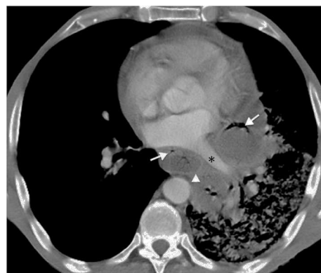
Figura 2 Tomografía axial computarizada de tórax.

Varón de 55 años que consulta por dolor torácico intenso irradiado a espalda y fiebre de hasta 38,5 °C de una semana de evolución tras episodio de atragantamiento con espina de pescado. En la radiografía AP de tórax (fig. 1) se aprecia un desplazamiento hacia la derecha de la línea acigoesofágica (flechas) y nivel hidroaéreo (punta de flecha), además de un aumento de densidad en la mitad inferior del hemitórax izquierdo. En la imagen lateral se aprecia un nivel hidroaéreo en mediastino posterior (punta de flecha) y aumento de la densidad retrocardial (asterisco). Se realizó tomografía axial computarizada de tórax (fig. 2) donde se comprueba la presencia de una colección en mediastino posterior (flechas) en íntima relación con estructuras cardiovasculares izquierdas (asterisco). Se realiza drenaje mediastinito mediante videotoracoscopia resolviéndose el caso sin complicaciones.