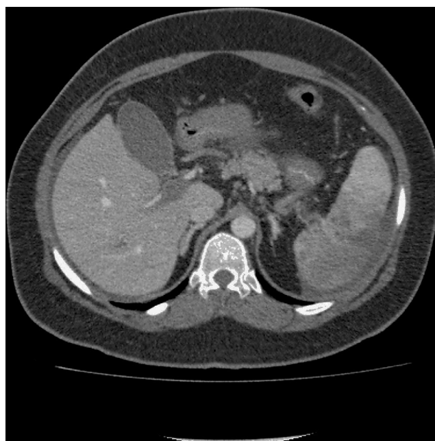
Figura 1 Angio-TC abdominal que muestra trombosis venosa portal e infarto esplénico. Imagen inicial realizada en la puerta de urgencias.

Al ingreso en la UCI, hipertensión arterial que se controla con fármacos, eupneica, consciente y orientada. Abdomen distendido, blando y con leve dolor, sin signos de irritación peritoneal. En analítica, PCR 10 mg/dl, PCT 0,15 ng/ml, leucocitos de 43 \times 10^3/\mu\text{l} , neutrófilos de 35 \times 10^3/\mu\text{l} y lactato de 7 mg/l, con el resto de parámetros analíticos normales. Se inicia anticoagulación con enoxaparina sódica, se deja en ayunas y se solicita estudio de trombofilia.