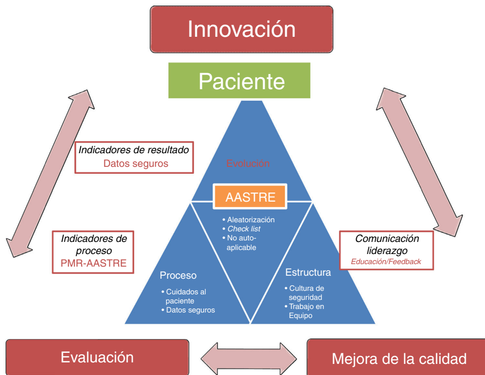
Figura 3 Entorno AASTRE.