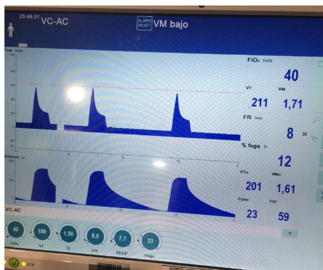
Figura 2 Curvas de presión y volumen en la paciente en ECMO vv y ventilación ultraprotectora. Con Vt de 199 ml se alcanzan presiones pico de 59 mbar.

mejora la oxigenación, reduce el CO 2 y permite reducir el riesgo de lesión pulmonar asociada a la VM mediante una ventilación protectora (Vt entre 4-6 ml/kg) o ultraprotectora (Vt < 4 ml/kg) 3 .