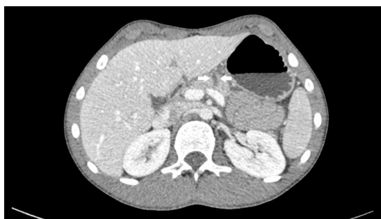
Figura 1 TAC. Las flechas indican el lugar de la rotura.