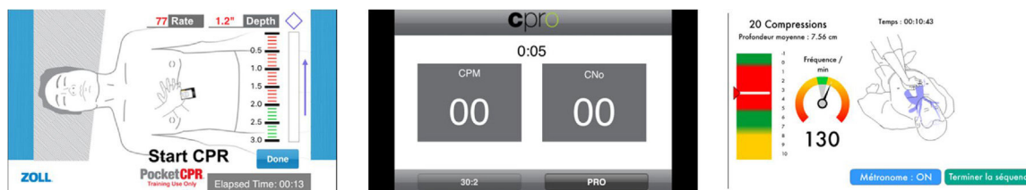
Figura 1 APP seleccionadas: Pocket CPR®, CPR Pro®, Massage cardiaque et DSA®.

Se recogieron los datos demográficos para caracterizar a la muestra. Las variables independientes fueron la media de profundidad en mm (MP), el ritmo medio de compresiones por minuto (RM), el porcentaje de posición correcta de manos (CPM), el porcentaje de compresiones con reexpansión correcta (CRC), el porcentaje de compresiones con profundidad correcta (CPC), el porcentaje de compresiones al ritmo correcto (RC) y la calidad global (QRCP) de acuerdo a las guías ERC 2015 14 . Estas variables fueron recogidas con el software Laerdal Resusci Anne Wireless SkillReporter versión 2.0.0.14 (Stavanger, Noruega). El software Resusci Anne Wireless SkillReporter® proporciona un parámetro general, denominado calidad de la reanimación (QRCP), calculado en base a cuatro variables del masaje cardiaco (profundidad, ritmo, posición de manos y reexpansión). Esta es una variable de uso muy frecuente en la investigación con simuladores Laerdal 15-17 . El resultado proporcionado va del 0 al 100%. Si el rendimiento de RCP se desvía del estándar, la puntuación se reduce. Cuanto mayor es la desviación, más se reduce la puntuación. Para la variable QRCP se aceptó como RCP de calidad la que superara el 70% 18 .