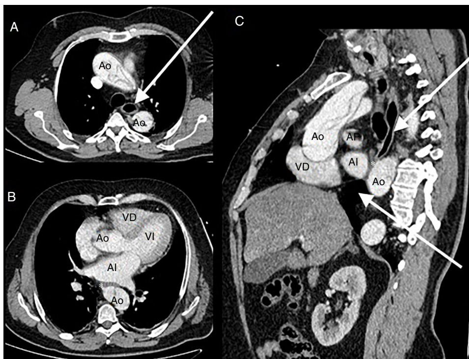
Figura 2 TC toracoabdominal. A. Imagen axial preestenótica, donde se observa dilatación esofágica y disección aórtica. B. Imagen axial de la zona de compresión (asterisco blanco). C. Imagen coronal que demuestra aflamamiento esofágico progresivo. AI: aurícula izquierda; Ao: aorta con imagen de flap aórtico; AP: arteria pulmonar; VD: ventrículo derecho; VI: ventrículo izquierdo. Flecha blanca: dilatación esofágica pre y postestenosis. Asterisco blanco: zona de obstrucción esofágica.

urgente. Tras la intervención ingresa en la Unidad de Cuidados Intensivos. Para asegurar la nutrición enteral se intenta colocar una sonda nasogástrica con dificultades para su progresión, y se comprueba su posicionamiento con contraste, evidenciándose su malposicionamiento (fig. 1). Se revisa estudio de angio-TC torácico, observándose un hematoma aórtico secundario a la disección que produce compresión extrínseca del esófago con aflamamiento progresivo y dilatación previa a la obstrucción (fig. 2). Finalmente requiere la colocación endoscópica para superar la estenosis esofágica.