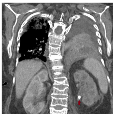
Figura 1 Cálculo renoureteral izquierdo.