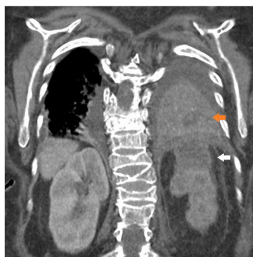
Figura 2 Absceso renal y neumonía abscesificada.